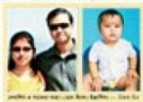
বাঙালি দম্পতি ফের প্রবাসে ফের 'সন্তানহারা' বাঙালি দম্পতি

প্রবাসে ফের 'সন্তানহারা' বাঙালি দম্পতি। এই রোগের লক্ষণসমূহ সাধারণত ২-৫ দিন স্থায়ী থাকে। এগুলোর মধ্যে হাঁচি-কাশি-জ্বর-পেচ-দুঃস্বপ্নের লক্ষণসমূহ সাধারণত ৫-৭ দিন স্থায়ী থাকে। এগুলোর পরে হৃদযন্ত্র ক্রিয়া এবং কিডনি-স্বাসনা, লিঙ্গ-প্রসূতি, পিত্ত-রক্ত-শোষণ-কেন্দ্রীয় ইত্যাদি অঙ্গ-প্রত্যঙ্গের ক্ষতি হয়।