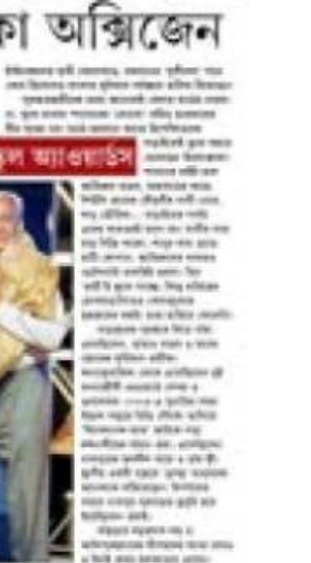
উজান বাওয়ার লড়াইকে সেলাম ঠোকা অভিজেন

উজান বাওয়ার লড়াইকে সেলাম ঠোকা অভিজেন। এই রোগের লক্ষণসমূহ সাধারণত ২-৫ দিন স্থায়ী থাকে। এগুলোর মধ্যে হাঁচি-কাশি-জ্বর-পেচ-দুঃস্বপ্নের লক্ষণসমূহ সাধারণত ৫-৭ দিন স্থায়ী থাকে। এগুলোর পরে হৃদযন্ত্র ক্রিয়া এবং কিডনি-স্বাসনা, লিঙ্গ-প্রসূতি, পিত্ত-রক্ত-শোষণ-কেন্দ্রীয় ইত্যাদি অঙ্গ-প্রত্যঙ্গের ক্ষতি হয়।